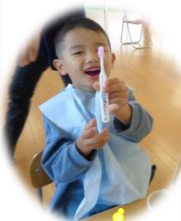
見て~キレイになったよ~