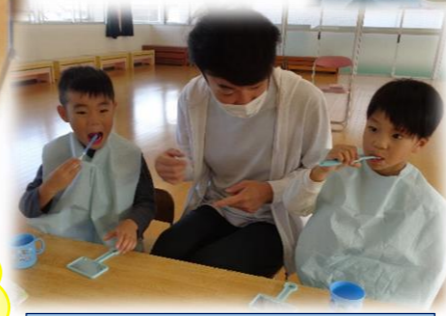
「こんにちは」の持ち方で