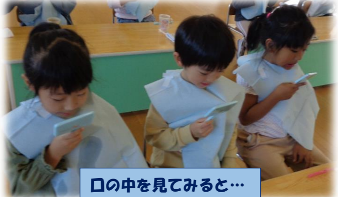
口の中を見てみると…