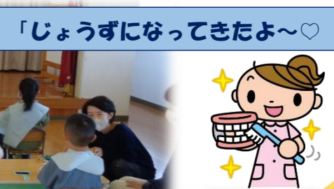
ありがとう ございました♡