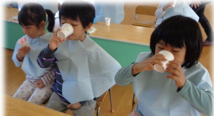
まずは「魔法の液」でうがいをして…