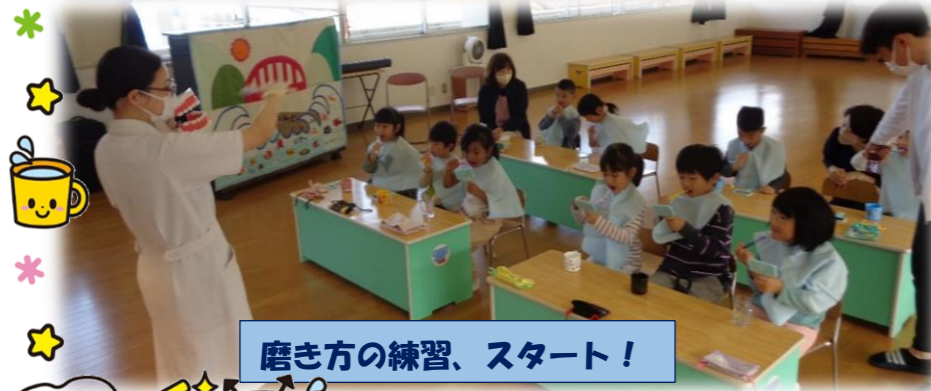
磨き方の練習、スタート!