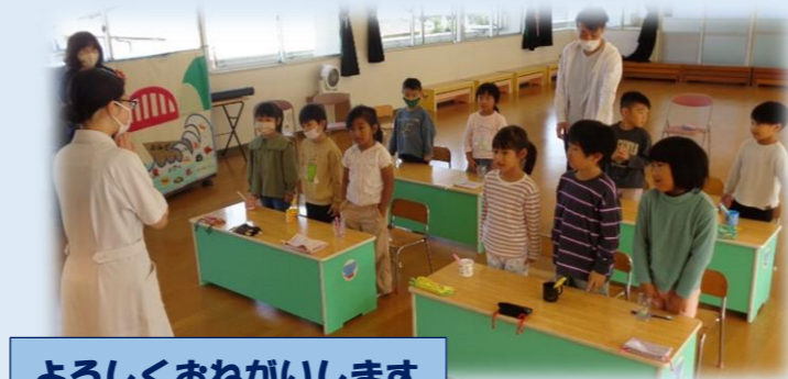
よろしくおねがいします