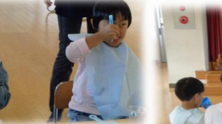
「さようなら」の持ち方は?